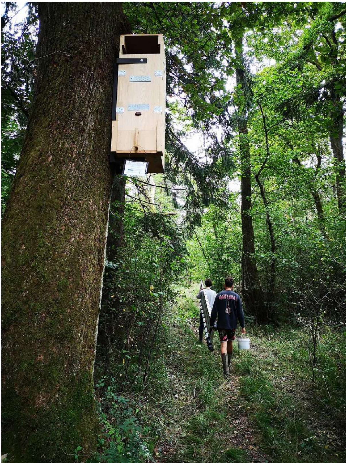
Slika 14. Gojilnica za puščavnika, ki je pritrjena na zdrav in stabilen hrast na območju Mestnega loga