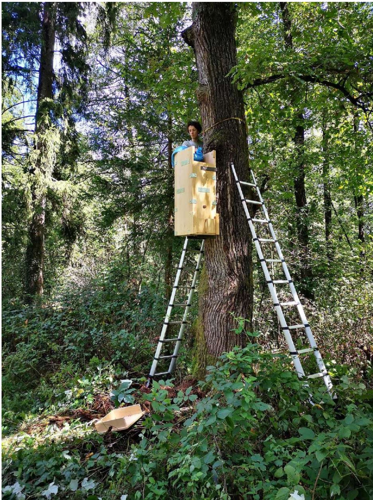
Slika 16. Polnjenje gojilnic z lesnim muljem (hranilnim substratom).