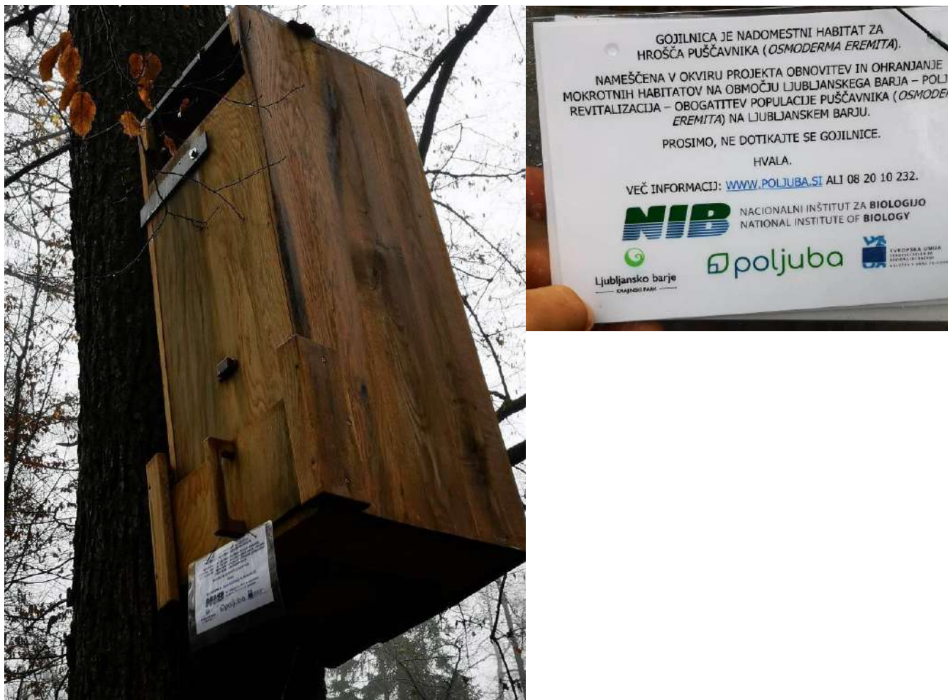
Slika 8. Postavljene gojilnice smo označili z oznakami na katerih smo napisali osnovne podatke o namenu postavljenih gojilnic.