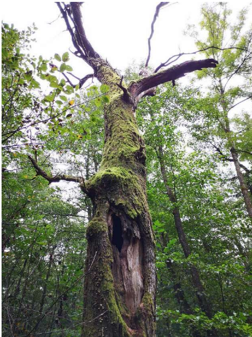
Slika 3: Mestni log je, kljub antropogenemu nastanku, primeren gozd z dovolj starimi drevesi in potencialnimi dupli, kjer bi se populacija puščavnika lahko vzdrževala sama.