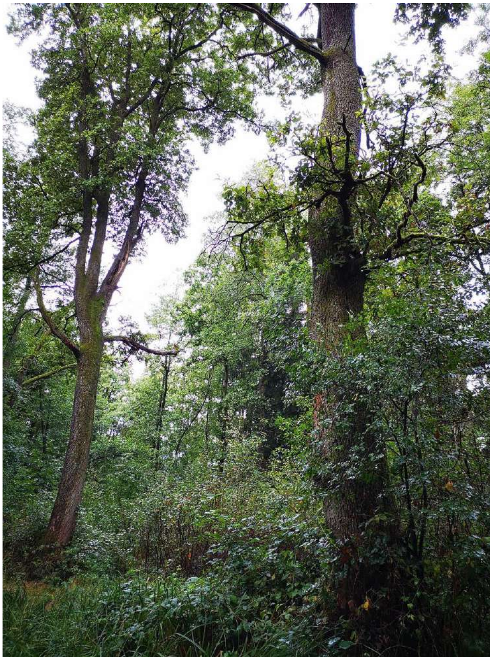
Slika 2: Območje Mestnega loga, kjer smo v letih 2019 in 2020 doselili puščavnika ( Osmoderma eremita ).