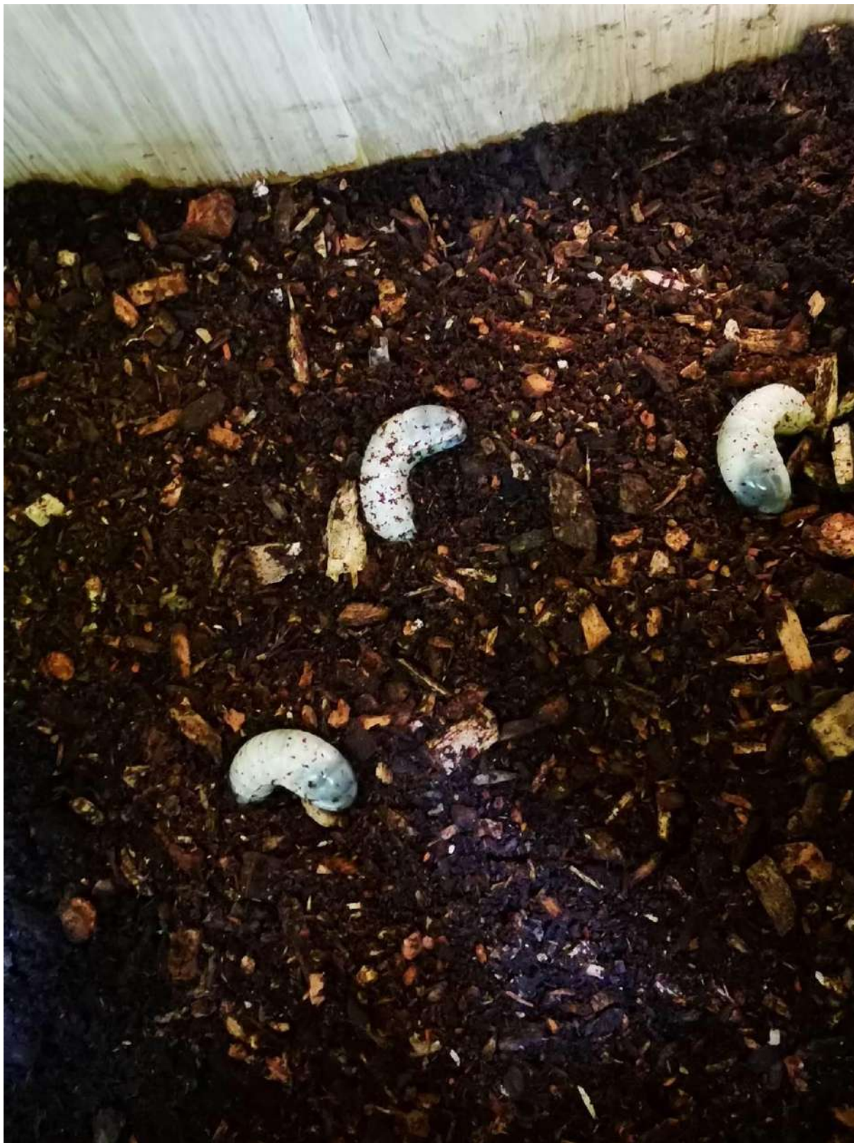
Slika 11. Ličinke puščavnika se hitro same zakopljejo v lesni mulj (hranilni substrat).