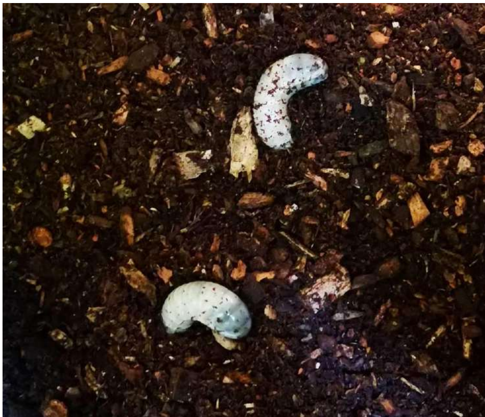
Slika 17. Ličinke puščavnika nežno z rokavicami položimo na lesni milj in same se zakopljejo v lesni mulj. (foto S. Kocijančič)