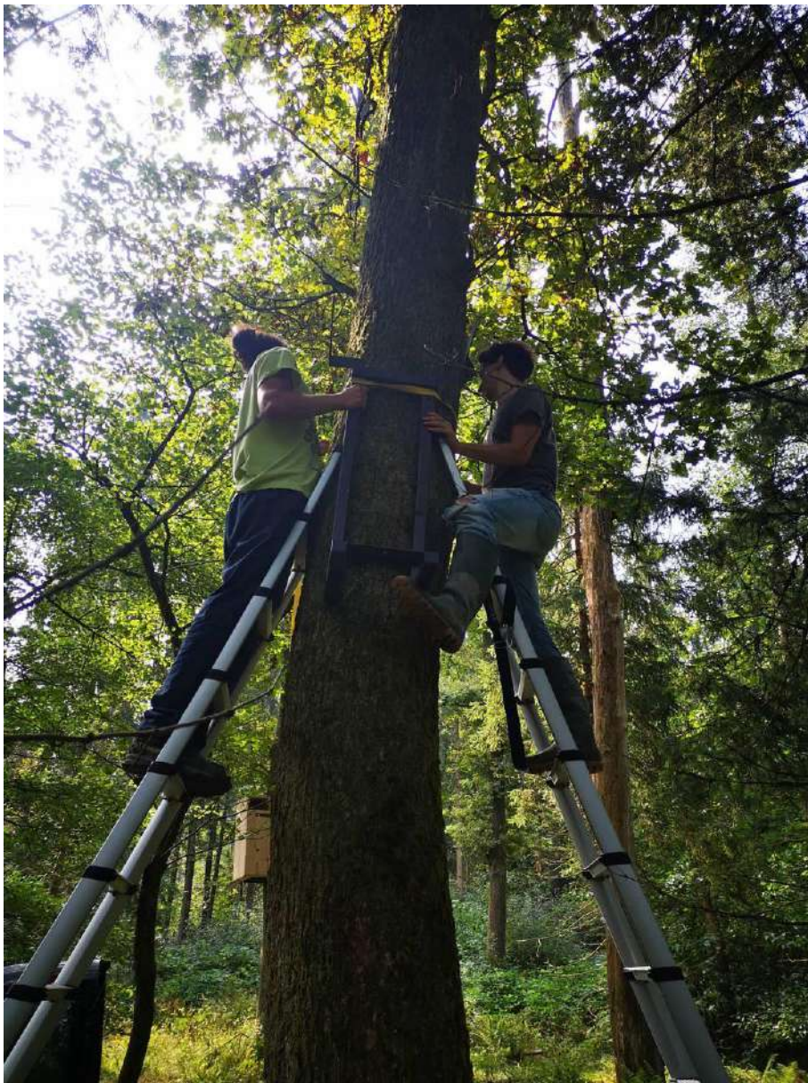
Slika 5. Nameščanje kovinske konstrukcije (nosilec) gojilnice.

Na vsaki lokaciji smo izbrali pet zdravih dreves z dovolj velikim prsnim premerom, vsaj 60 cm, ki naj bi zdržala obremenitev z gojilnico. Na samo drevo smo najprej z nerjavečimi vijaki pritrčili kovinsko konstrukcijo, ki služi kot nosilec za gojilnico (Slika 5). Na to konstrukcijo smo potem z vijaki pritrčili gojilnico (Slika 6). Vse gojilnice so pritrjene na višini približno 3 metre. Gojilnica je zgrajena iz odpornejšega lesa, visoka 1,2 metra in osnovno ploskvijo 35 x 40 centimetrov (Slika 7). Opremljena je s pokrovom, ki ga je mogoče odstraniti za lažjo dostopnost in loputo pri dnu, da lahko preverjamo viabilnost ličink puščavnika, saj se te večinoma zadržujejo na dnu lesnega mulja (hranilnega substrata). Pri vrhu je odprtina velikosti 20 cm, ki služi kot vhod v umetno duplo (Slika 7). Postavljene gojilnice smo označili z oznakami na katerih smo napisali osnovne podatke o namenu postavljenih gojilnic (Slika 8).