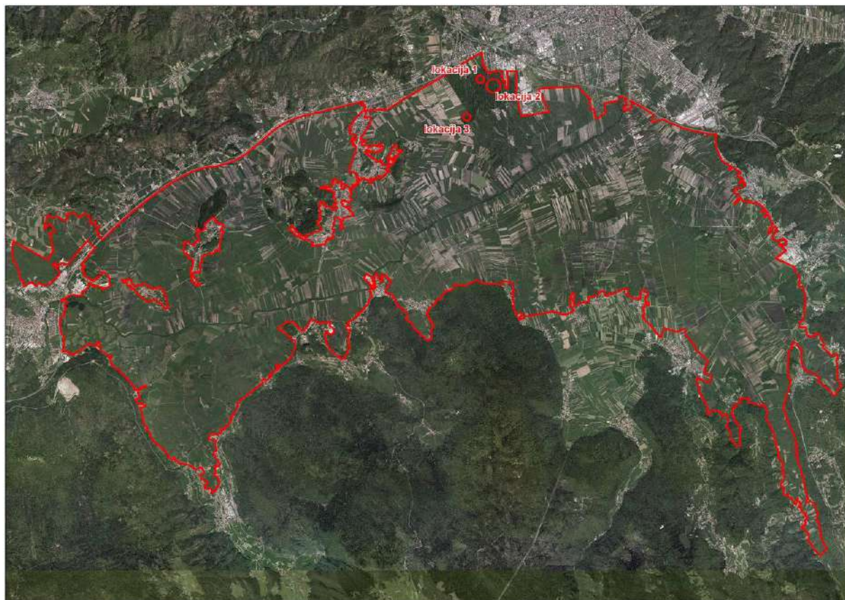
Slika 1: V sklopu popisov habitatnih dreves na Ljubljanskem barju v letih 2018 in 2019 smo ugotovili, da bi bilo območje Mestnega loga najbolj primerno območje za doselitev puščavnika ( Osmoderma eremita ).

V letih 2018 in 2019 smo popisali primerna habitatna drevesa na območju Ljubljanskega barja (Ambrožič Ergaver s sod. 2019). V sklopu teh popisov smo ugotovili, da bi bilo območje Mestnega loga najbolj primerno območje za doselitev puščavnika (Slika 1). Mestni log je, kljub antropogenemu nastanku, primeren gozd z dovolj starimi drevesi in potencialnimi dupli, kjer bi se populacija puščavnika lahko vzdrževala sama (Slika 2) Na tem območju smo izbrali tri parcele, ki so primerne za doselitev puščavnika (Slika 3). Doselitev smo izvedli v letih 2019 in 2020.