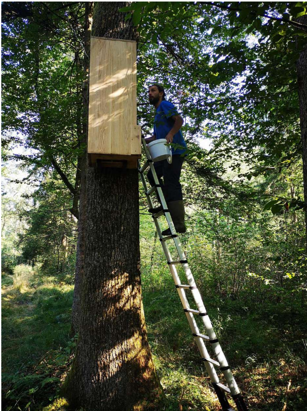
Slika 10. Ličinke puščavnika prenašamo v posodi brez prijemanja z rokami. Če se ne moremo izogniti dotikanju, potem pri rokovanju uporabljamo lateks rokavice.