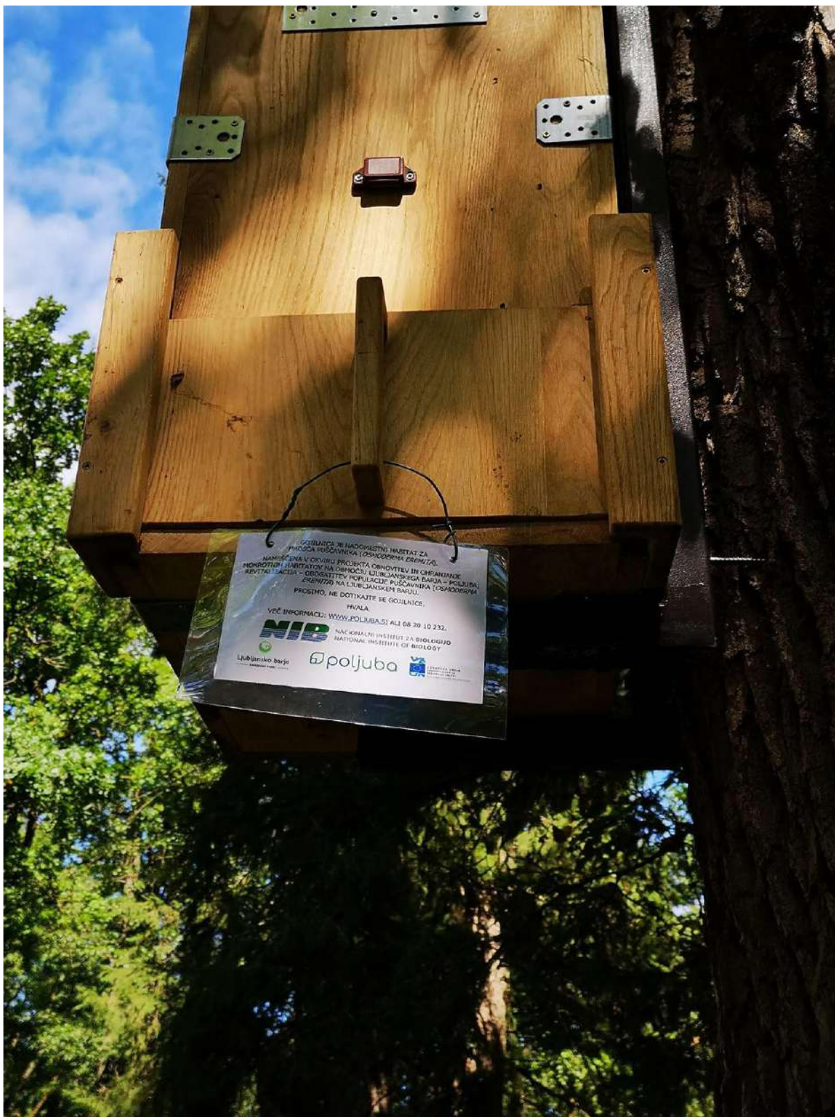
Slika 15. Postavljene gojilnice smo označili z oznakami na katerih smo napisali osnovne podatke o namenu postavljenih gojilnic.