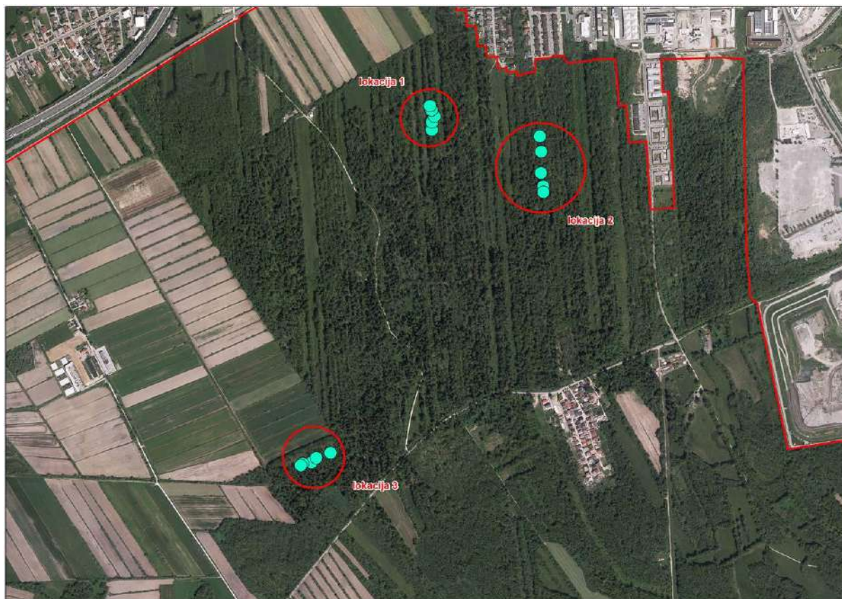
Slika 12: Izbrane lokacije postavljenih gojilnic za doseljene osebkje puščavnika ( Osmoderma eremita ) na območju Mestnega loga, kjer smo v letu 2020 drugič doselili puščavnika.