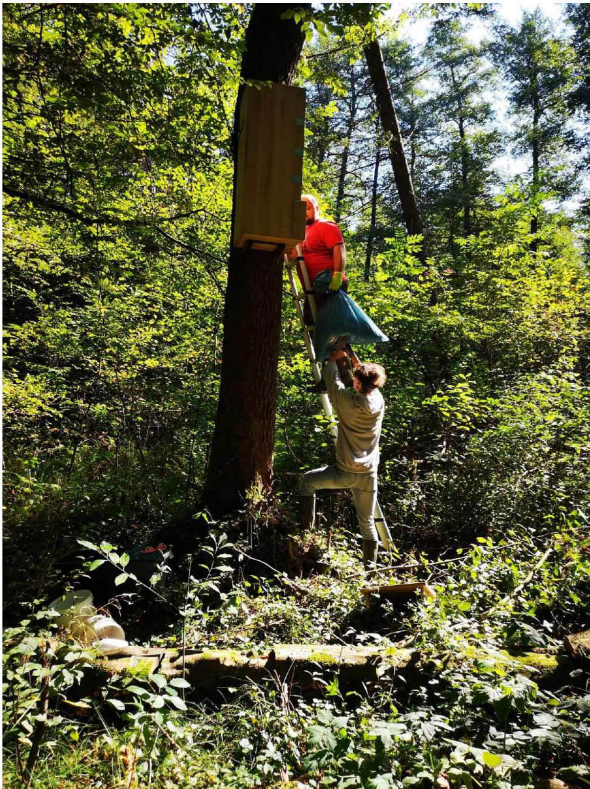
Slika 9. Polnjenje gojilnic z lesnim muljem (hranilnim substratom).