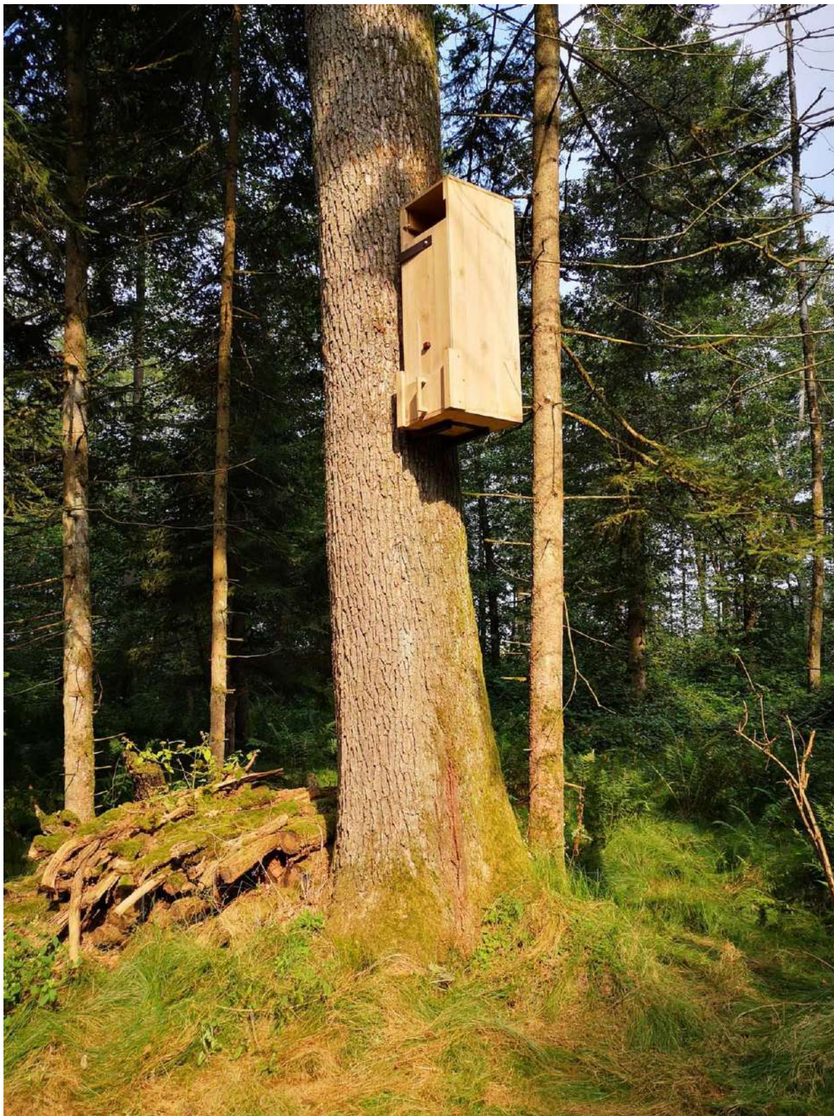
Slika 7. Gojilnica za puščavnika, ki je pritrjena na zdrav in stabilen hrast na območju Mestnega loga