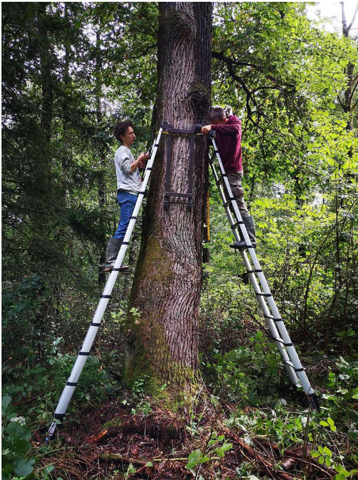
Slika 13. Nameščanje kovinske konstrukcije (nosilec) gojilnice.