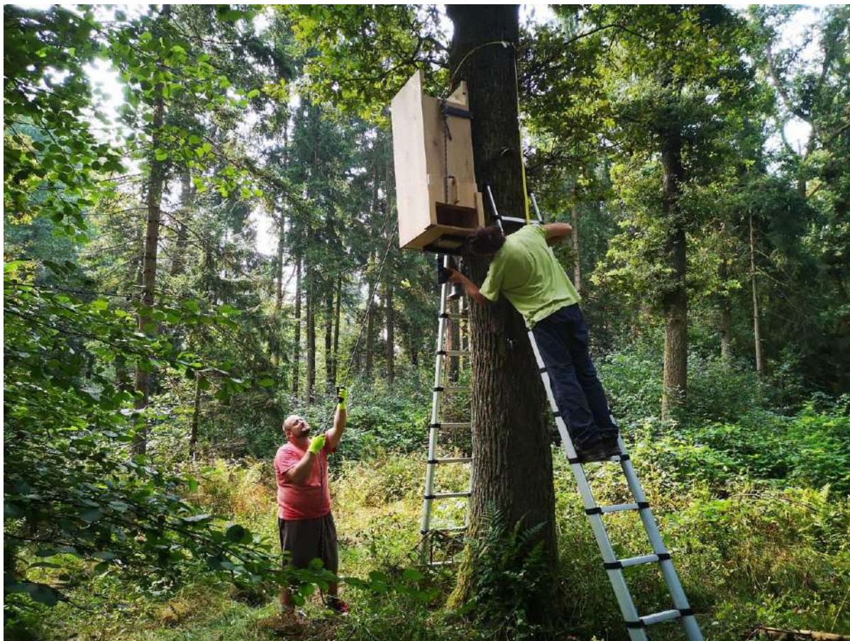
Slika 6. Pritrjevanje gojilnice na postavljeni nosilec.