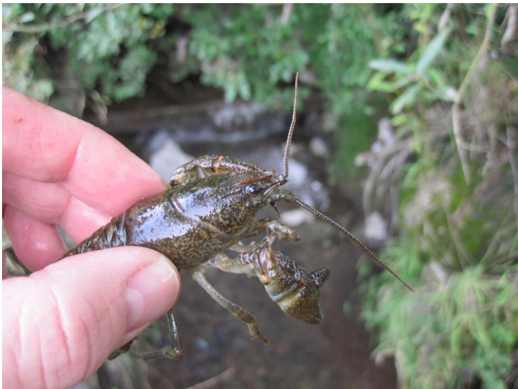
Slika 4: Koščak ( Austropotamobius torrentium ) iz potoka Radna.