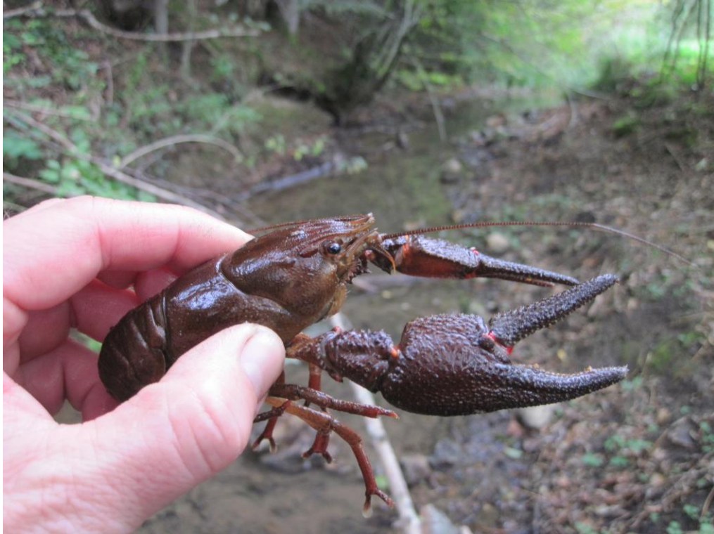
Slika 3: Jelšavec ( Astacus astacus ) iz potoka Izbarica.