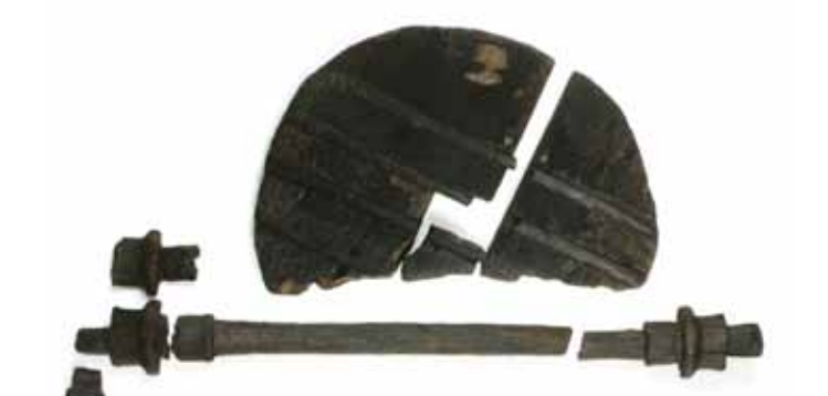
Kolo z osjo. Hrani Mestni muzej Ljubljana.