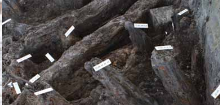
Leseni koli – piloti.