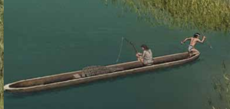
Ribiča na deblaku.