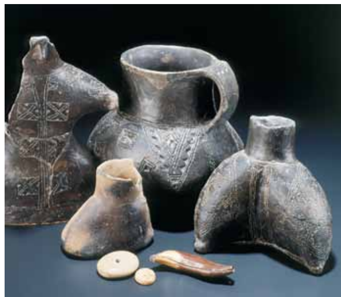
Posode, glinena figurica in obeski s kolišč pri Igu. Hrani Narodni muzej Slovenije.

Raziskave pilotov – lesenih nosilcev, na katerih so stale hiše, kažejo, da so bile hiše v koliščih različno velike. Stene hiš so bile narejene iz lesa, iz prepletenih vej, plasti gline in drugih materialov. Raziskave po drugih koliščih po Evropi kažejo, da je posamezna vas štela od 5 do 80 hiš, v večjih naseljih pa je živelo tudi do 500 ljudi.