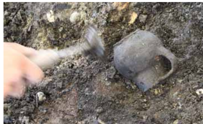
Lončena posoda ob izkopavanju. Hrani Mestni muzej Ljubljana.

Od prvih odkritij kolišč na Ljubljanskem barju je minilo več kot 130 let. Obsežna izkopavanja s konca 19. stoletja, sistematične raziskave v dvajsetem stoletju ter sodobne, predvsem z naravoslovnimi vedami okrepljene raziskave, so močno razširili vedenje o najstarejših stalnih prebivalcih Ljubljanske kotline. Danes je poznanih že več kot 40 kolišč, zadnje je bilo odkrito leta 2009 v Ljubljani. Najdbe s kolišč hranita Mestni muzej Ljubljana in Narodni muzej Slovenije.