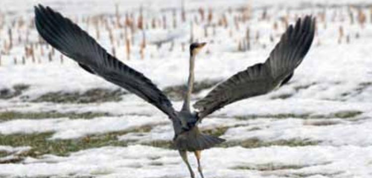
Siva čaplja ( Ardea cinerea ).