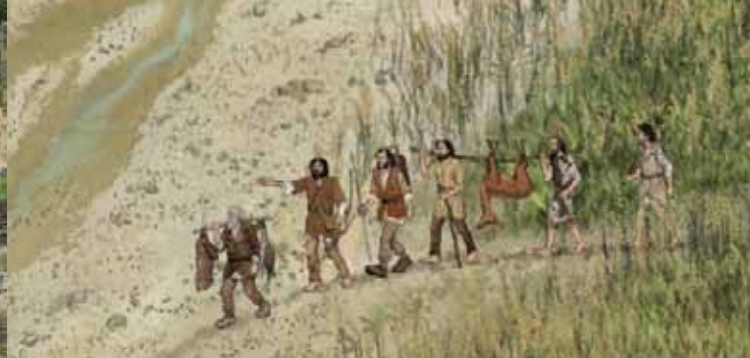
Lovci ob vmitvi z lova.