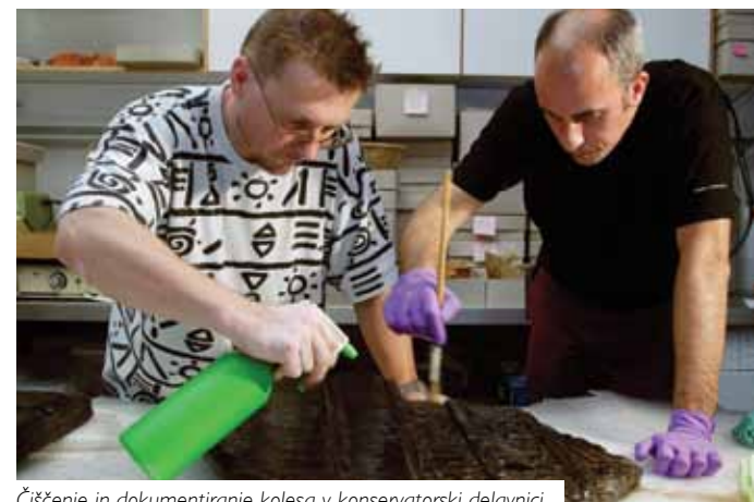
Čiščenje in dokumentiranje kolesa v konservatorski delavnici.