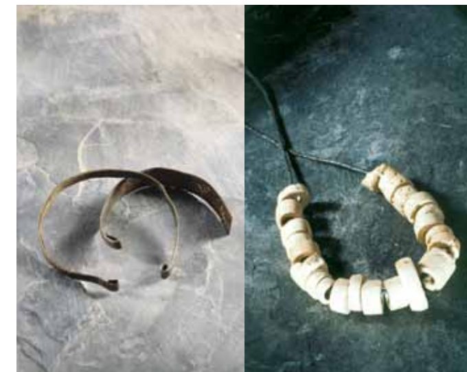
Bakreni zapestnici in ogrlica iz kamnitih jagod s kolišč pri Igu. Hrani Narodni muzej Slovenije.

Tkanine so izdelovali s pomočjo preslic in predilnih vretenc, tkali so jih s pokončnimi statvami z utežmi za nitke. Tako narejeno blago so barvali z rastlinskimi barvili. Oblačila in obutev so izdelovali tudi iz živalskih kož in drugih dostopnih surovin. Pri šivanju so si pomagali z iglami iz živalskih kosti.