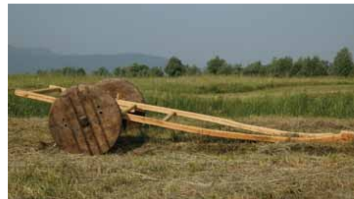
Rekonstrukcija dvokolesnega voza.

Koliščarji niso gradili cest. Po kopnem so razdalje premagovali peš, od konca 4. tisočletja naprej pa tudi z vozovi, ki jih je verjetno vleklo govedo. Najbolj običajne pa so bile vodne poti. Najpogostejše prevozno sredstvo so bili čolni deblaki, izdelani iz enega debla. S čolni, dolgimi tudi 12 metrov, so lahko prevažali tudi večje predmete.