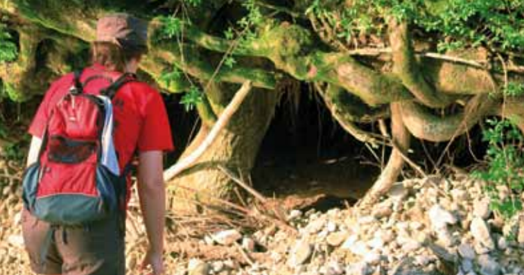
Pred vidrino v Iški