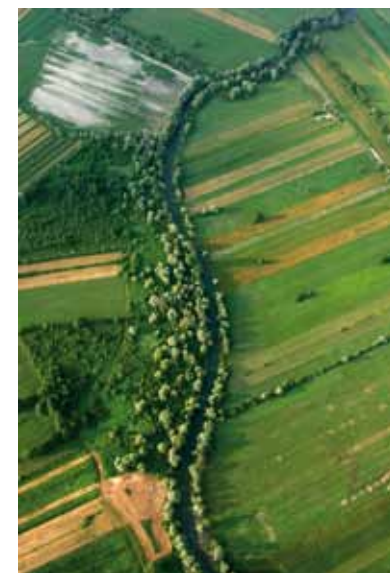
Iščica na Ljubljanskem barju