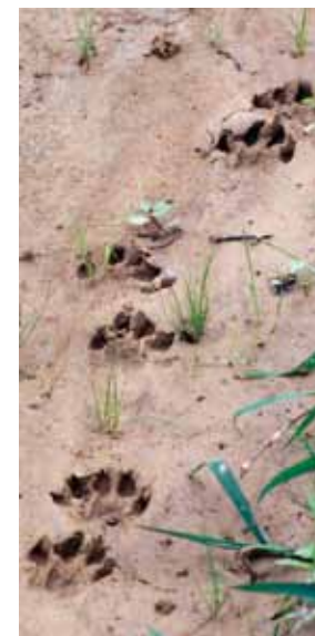
desno: Vidrine sledi