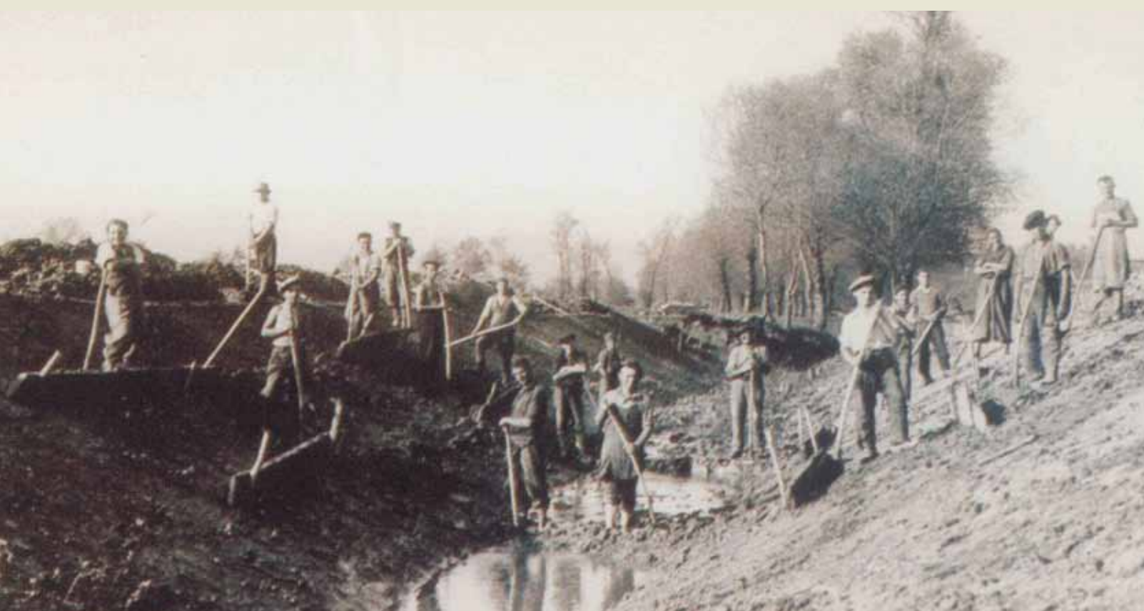
Ročno kopanje jarka v Bevkah

! Človek je hotel Ljubljansko barje že večkrat osušiti, da bi pridobil zemljišča za pridelavo hrane . O tem pričajo številni kanali , kamor se zbira odvečna voda. Ta se na travnike in njive vedno znova vrača v posmeh stoletnim poskusom osušitve. Pot, po kateri si prišel s kmetije Kamin (Komin) , je bila nasuta leta 2009 in je pod vodo le ob izjemnih poplavah.